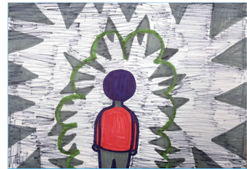
소년은 화가 나고 힘들었지만, 용감하게 맞설 수 있는 용기가 없었습니다.