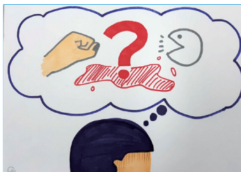
소년은 “어떻게 할까?” 생각을 했습니다.