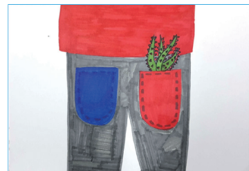
그러다 가시나무를 꺾어서 자신의 주머니에 넣었습니다.

※ 출처 : http://blog.naver.com/bony30?Redirect=Log&logNo=80196502175