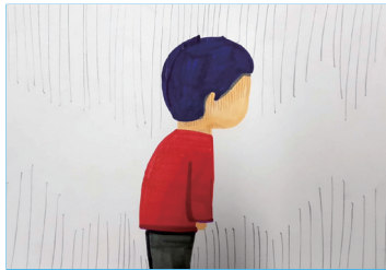
한 소년이 있었습니다.

Q 아래는 한 소년의 이야기입니다. 소년의 기분을 생각하며, 이야기를 읽어 봅시다.